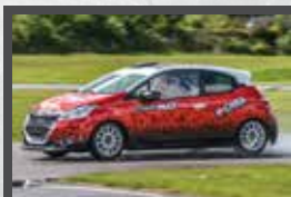
208 RACING CUP 150 ch