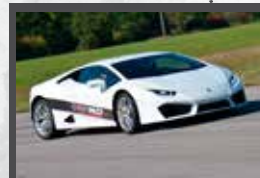
LAMBORGHINI HURACAN 580 ch