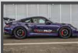
PORSCHE GT3 RS 500 ch