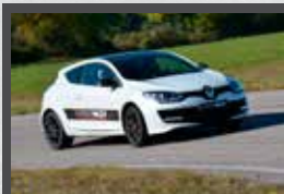
MEGANE RS 275 ch