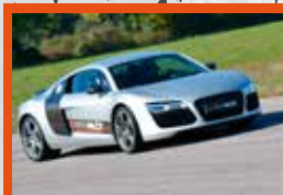
AUDI R8 420 ch