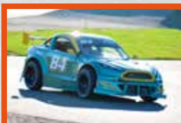
MITJET 150 ch pour 500 kg !