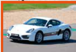
PORSCHE CAYMAN 285 ch