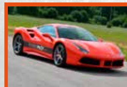
FERRARI 488 670 ch