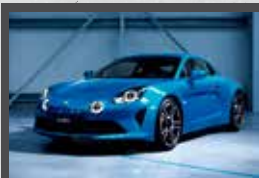
ALPINE A110 285 ch