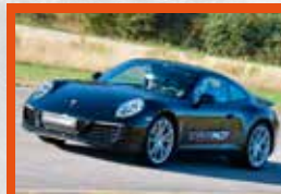
PORSCHE 911 420 ch