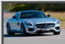
AMG GTS 510 ch