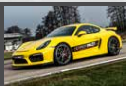
PORSCHE GT4 385 ch